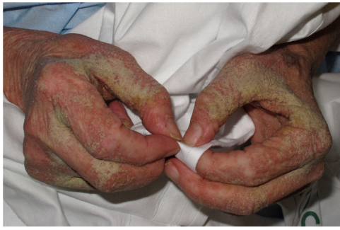
Figura 3 Sarna noruega en una anciana con demencia senil. Placas hiperqueratósicas en ambas manos. La sarna noruega es más frecuente en pacientes con alteraciones neuropsiquiátricas, inmunosuprimidos, hemodializados e individuos con diabetes mellitus, entre otros. En este caso, la paciente recibió 3 dosis de ivermectina oral (200 \mu\text{g}/\text{kg} ) junto con múltiples aplicaciones de permetrina tópica al 5% y de vaselina filante, con respuesta clínica completa. Se indicaron además rigurosas medidas higiénicas y de manejo de fómites, dada la alta probabilidad de contagio.